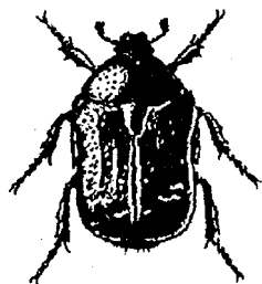
Le larve della Cetonia dorata si nutrono di parti di vegetali morti, per questo stanno volentieri nei mucchi di composto.

In un giardino anche spazi e materiali che sembrano morti ospitano una moltitudine di esseri viventi: su superfici ghiaiose o sabbiose senza vegetazione vivono ad esempio i coleotteri del genere Cicindela e diverse specie di formiche; nei mucchi di sassi e nei muri a secco soleggiate vivono lucertole, nei luoghi più ombreggiati l'Orbettino. Sotto i mucchi di rami più grossi sverna il Riccio.