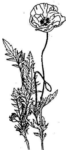
Il Rosolaccio è un rappresentante della flora dei campi.

nel caso di flora dei campi zappare di tanto in tanto singole parti dell'aiuola (mai tutto in una volta!).