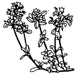
Il Timo serpillio sopporta bene anche uno sfalcio frequente

si può ottenere più velocemente lo stesso risultato se si sostituisce il terreno ricco di sostanze nutritive con un miscuglio di terra, sabbia e ghiaia, seminando poi la superficie con un appropriato miscuglio di semi. Questo intervento richiede però molto lavoro e spesso non tutte le specie seminate sono adatte al luogo: molte di esse vengono soppiantate da altre specie e scompaiono dopo uno o due anni. Utilizzate solo miscugli di semi di specie che sono presenti nella vostra regione.