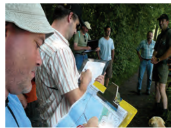
Imprimé sur Cyclus print recyclé.

En prévision de l'année internationale de la biodiversité 2010, l'ASPO coordonne des activités importantes avec le Forum Biodiversité Suisse et l'Office fédéral de l'Environnement OFEV.