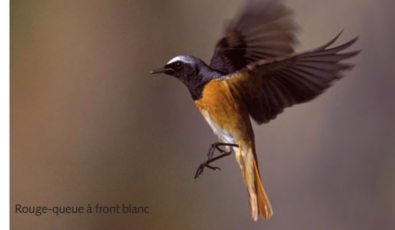
Rouge-queue à front blanc

les oiseaux des atteintes directes. Plusieurs dossiers importants nous ont occupé en 2009. La pression sur les piscivores continue. L'ASPO et ses partenaires ont du agir jusqu'au Tribunal fédéral pour éviter que les hérons cendrés ne soient décimés dans le canton de Fribourg. Les juges ont donné raison aux associations; grâce à notre engagement, les pisciculteurs devront mettre en place des mesures de prévention non létales pour cette espèce protégée. Afin d'éviter les nombreuses pertes d'oiseaux lors de collisions avec des vitres l'ASPO et