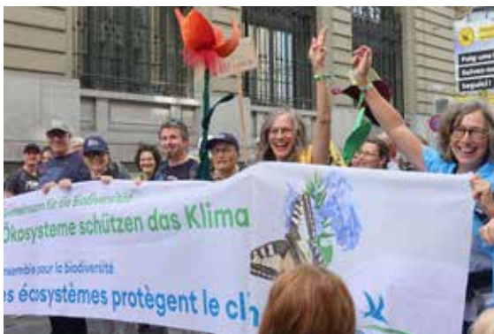
60'000 personnes ont donné de la voix pour la nature le 30 septembre à Berne.

L'initiative pour la biodiversité connaît un destin mouvementé. La commission du Conseil des Etats a refusé à deux reprises de mener le moindre débat de fond et n'a donc même pas voulu examiner les solutions possibles à la crise de la biodiversité. Le Conseil fédéral, le Conseil national, les cantons, l'association des communes et de nombreuses associations issues de l'économie et de la société souhaitent pourtant un contre-projet indirect à cette initiative. Les organisations de soutien se sont montrées très ouvertes au compromis et accepteraient même un contre-projet fortement édulcoré, élaboré par l'administration. Mais certains membres du Conseil des Etats n'en veulent pas. Le contre-projet est donc sur le fil du rasoir. Ce n'est qu'en décembre que le Parlement décidera définitivement si un tel contre-projet verra le jour. BirdLife se mobilise en faveur d'un contre-projet et effectue en parallèle des travaux préparatoires en vue d'une éventuelle votation populaire qui pourrait avoir lieu au printemps 2024.