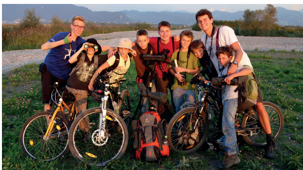
Matrix – die Pubertierenden & Appenzeller Sprösslinge

Route: Obertoggenburg – Bannriet – Rheindelta