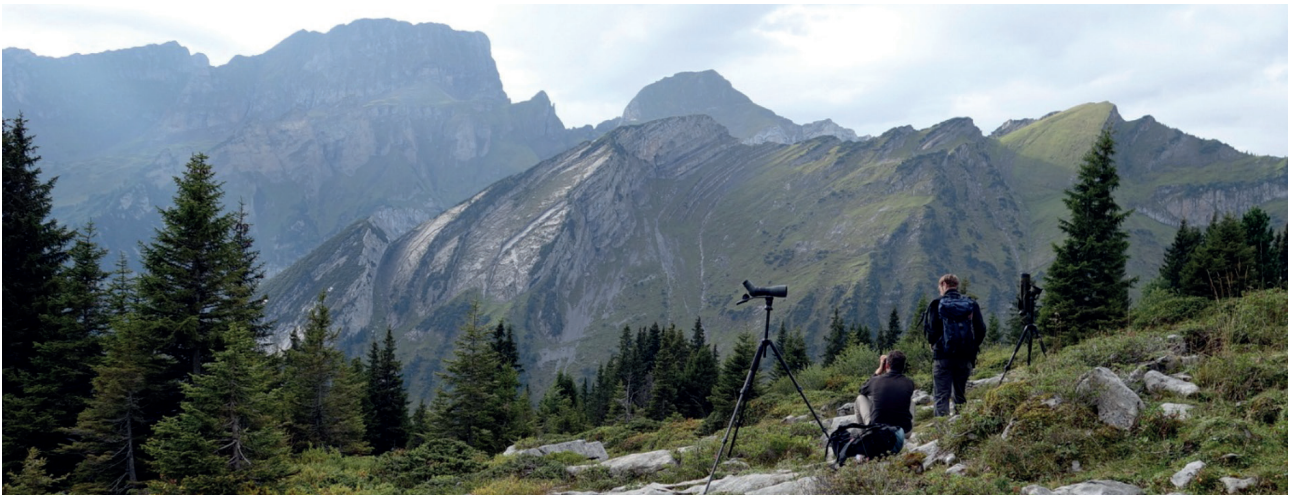
Team Nordwind unterhalb des Gamsers Rugg

tes Rauhfusshühner-Biotop, ohne jedoch Hasel- oder Birkhuhn anzutreffen. Andererseits wurden wir mit einer guten Kleinvogel-Artenliste belohnt, auch mit Steinadler und Wanderfalke, so dass der Weg hinunter nach Wildhaus bei bester Stimmung fortgesetzt werden konnte. Der erhoffte Dreizehenspecht blieb leider aus. Mit dem Postauto ging es flott ins Rheintal nach Buchs. Dank der Wahl der richtigen Sitzseite wurden aus dem Car zwei Wasseramseln im Fluss „Simmi“ entdeckt. Etwas später als vorgesehen kamen wir mit der Bahn in St. Margrethen an und wechsel-