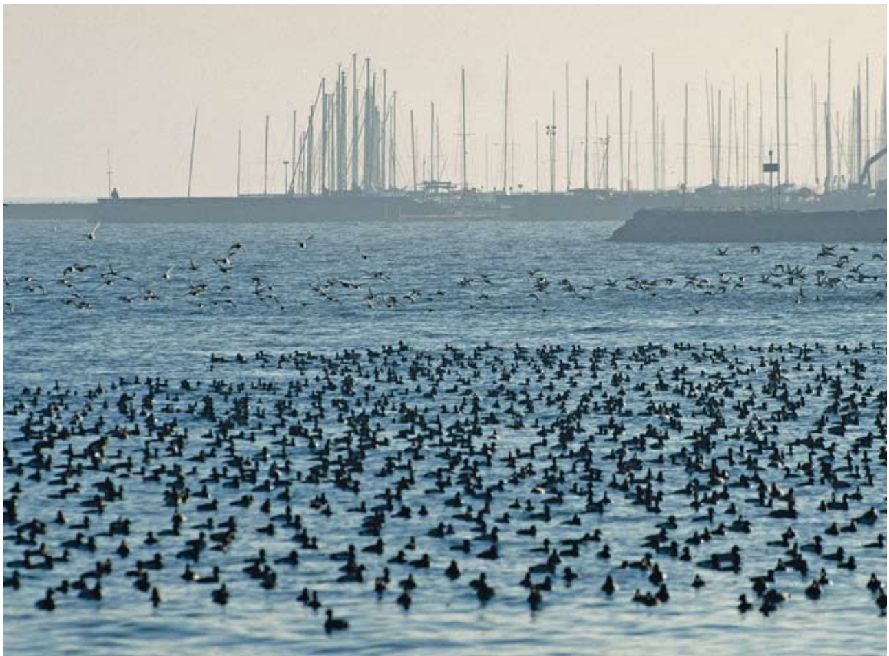
Gerne halten sich Hunderte von Tauchenten vor dem Hafen von Choiseul bei Versoix auf. Des centaines de canards plongeurs aiment séjourner devant le port de Choiseul, près de Versoix.