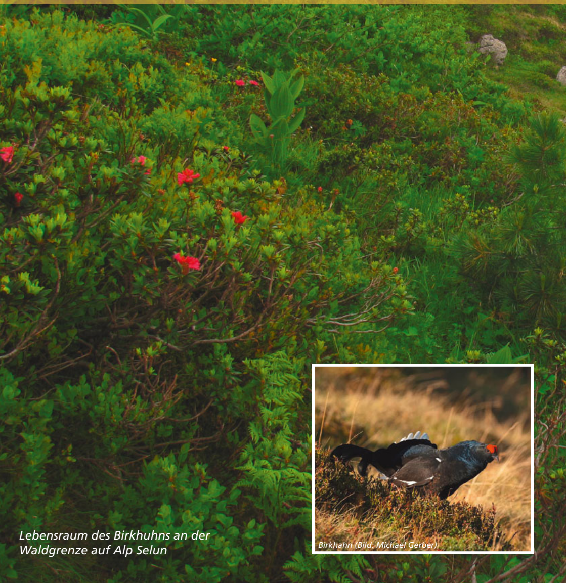
Lebensraum des Birkhuhns an der Waldgrenze auf Alp Selun