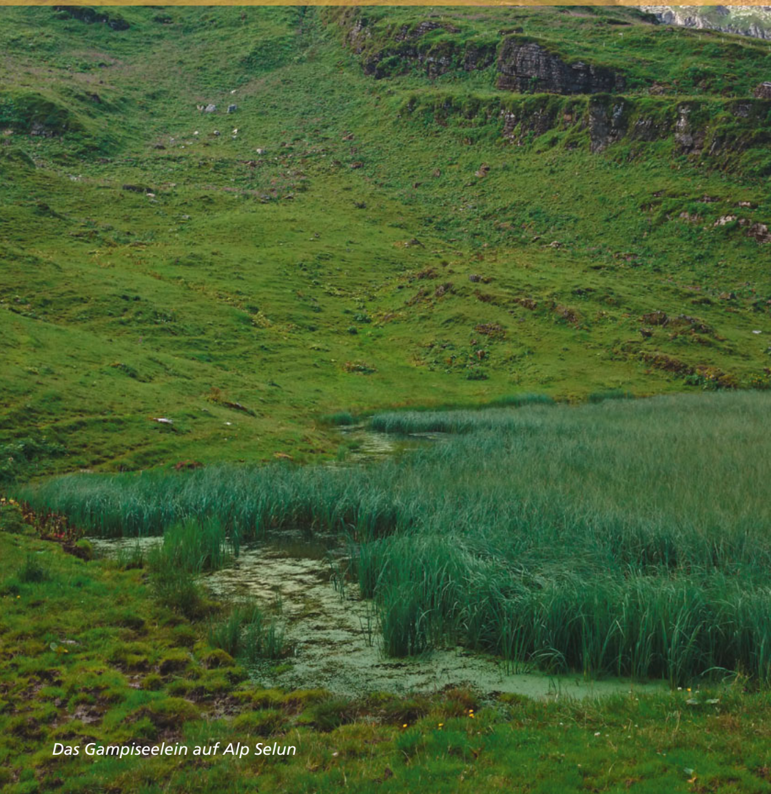
Das Gampiseelein auf Alp Selun