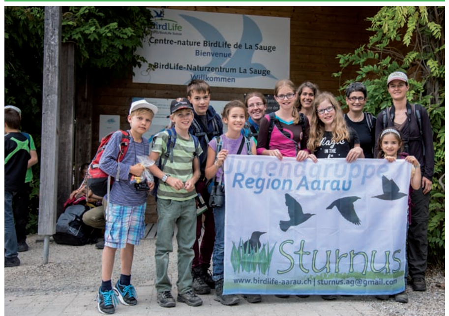
Des groupes de jeunes actifs dans les sections BirdLife en Suisse alémanique se sont retrouvés à La Sauge pour une journée d'animation.