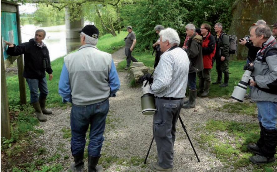
Présentation de la réserve de Cudrefin aux photographes-naturalistes (séminaire Canon).

Durant les vacances d'été, BirdLife organise des camps-nature destinés aux enfants ou adolescents. Ces semaines sont des occasions uniques de sensibiliser la jeunesse à la nature. Le premier camp non résidentiel a eu lieu au centre-nature de La Sauge et a proposé aux enfants une riche palette d'activités visant à découvrir la faune et la flore du site. Le second, organisé en collaboration avec le WWF Suisse, a eu lieu au col de Jaman. Les enfants ont eu l'occasion de découvrir le travail des bagueurs actifs à cette saison pour étudier les oiseaux migrateurs et les chauves-souris.