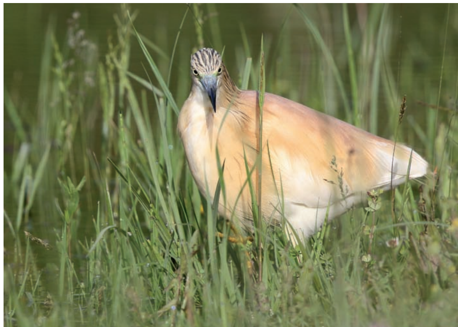
Le crabier chevelu est un hôte rare mais régulier en mai au bord des étangs.

(36), le martin-pêcheur (25) et le rougequeue à front blanc (13). Le pic épeichette et le bruant des roseaux s'ajoutent à la liste des oiseaux bagués sur le site. Un rossignol tardif a été contrôlé le 24 septembre. Le baguage permet de suivre l'évolution de l'avifaune après la période de reproduction en lien avec l'entretien des milieux naturels. C'est aussi un moyen de sensibiliser les visiteurs à la beauté des oiseaux.