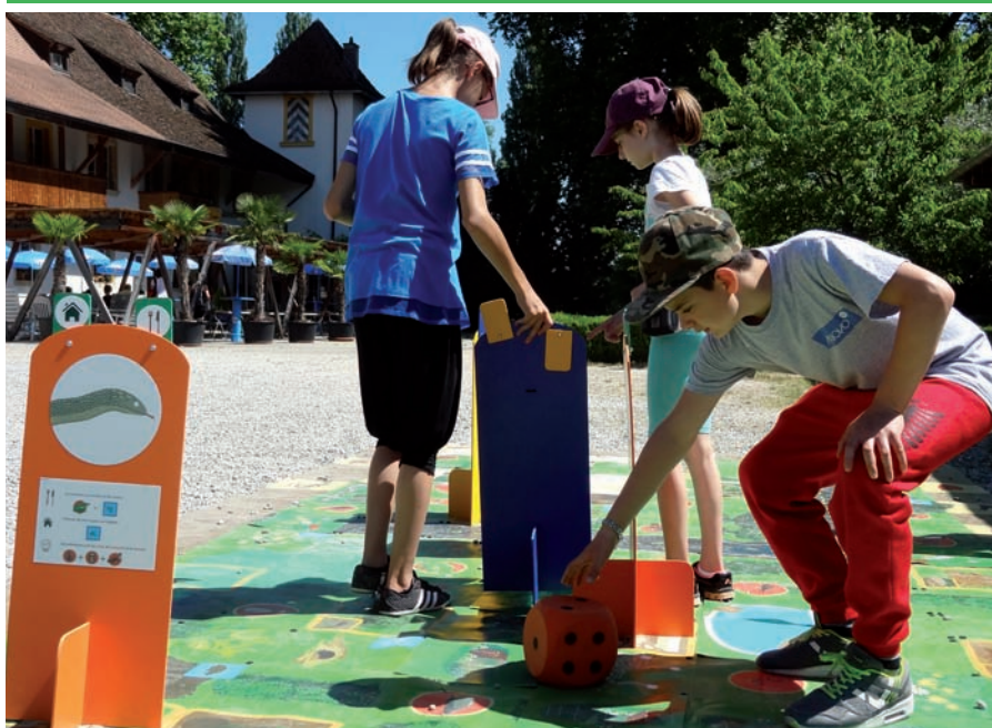
Le module d'animation «la nature près de chez soi» sensibilise les enfants par le jeu.

Près de 400 personnes ont pris part aux différentes activités organisées par le centre pour les adultes, familles et enfants. A fin mai, une activité en lien avec la nouvelle exposition « la nature près de chez soi » a été mise sur pied dans le cadre de la « fête de la nature ». La journée portes ouvertes a rassemblé 250 personnes qui ont pu participer à un concours sur le thème