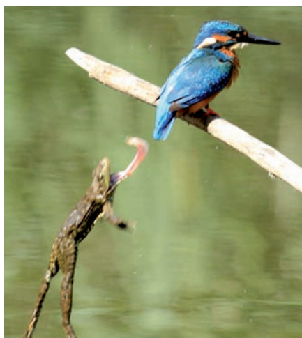
Une grenouille a les yeux plus gros que le ventre en essayant d'attraper un martin-pêcheur

La station de baguage a fonctionné une fois par semaine entre mi-juillet et fin octobre. 789 oiseaux de 37 espèces, ainsi que 75 contrôles ont été enregistrés. Par rapport à 2014, le nombre de captures a été sensiblement plus élevé. De nouveaux maxima ont été constatés pour le pouillot véloce (43 ind.), le gobemouche noir