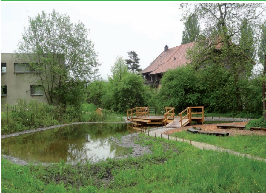
Le nouvel étang didactique offre plus d'espace aux visiteurs et groupes en animation.

public de créer le jardin de ses rêves à l'aide d'un écran tactile. Une présentation de petits animaux des maisons et des jardins complétait les panneaux didactiques. A l'extérieur, le visiteur pouvait découvrir les exemples d'aménagements favorables à la nature.