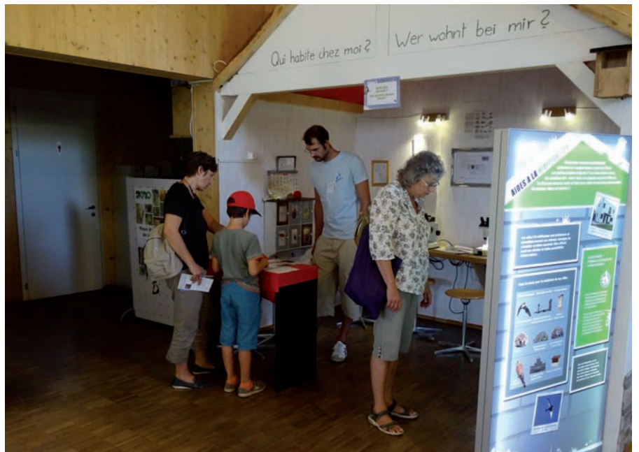
La nouvelle exposition «La nature près de chez soi».

Le centre-nature BirdLife de La Sauge a ouvert le 8 mars avec une nouvelle exposition interactive « la nature près de chez soi ». Réalisée dans le cadre