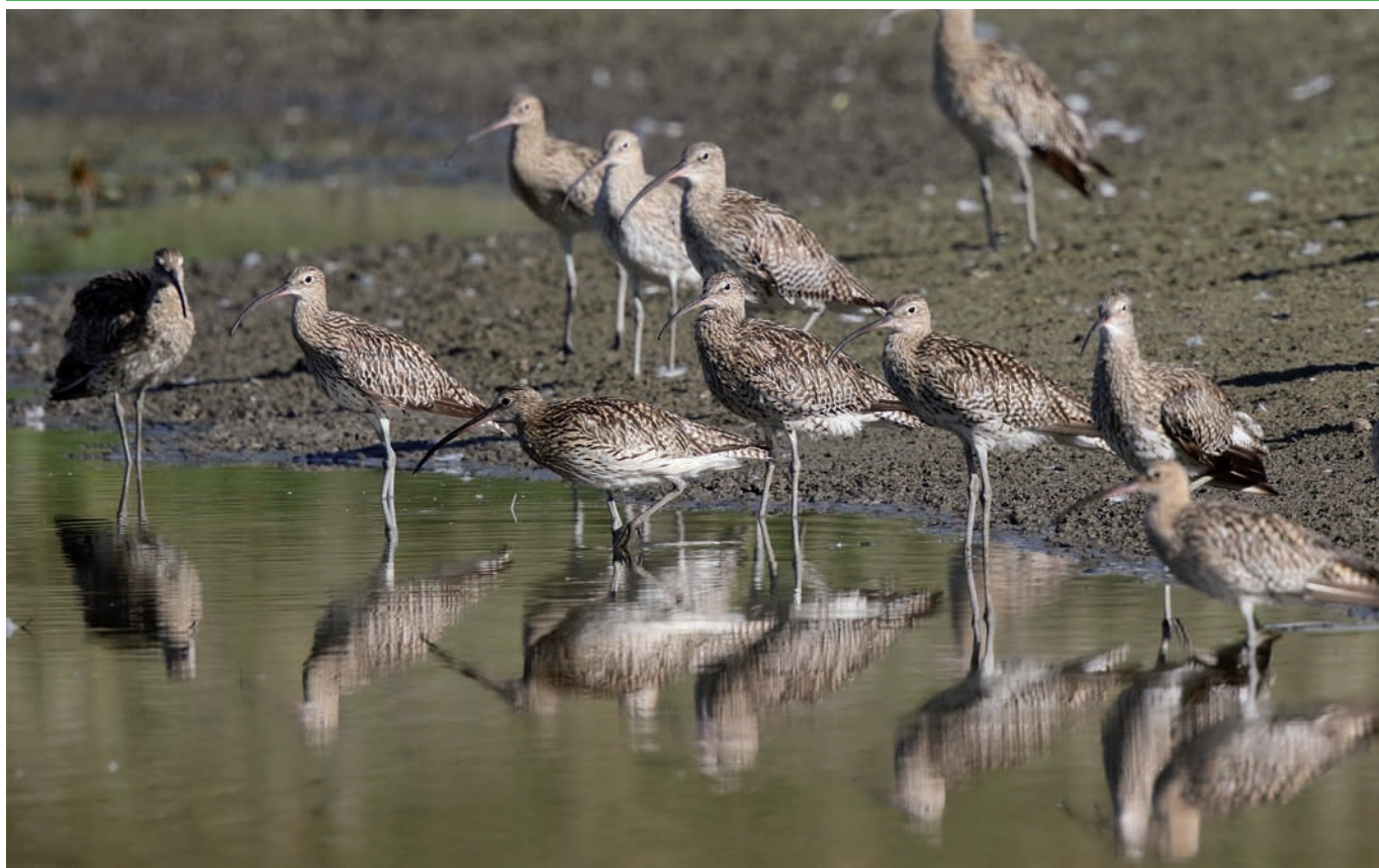
Les courlis cendrés ont fait une halte, pour le plus grand plaisir des yeux et des oreilles des visiteurs.

ont trouvé des champs inondés lors du passage printanier. Ils ont ainsi été moins nombreux que de coutume. 38% seulement du total des observations de canards et 28% des limicoles ont été enregistrés lors de la période de migration printanière. Les sarcelles d'hiver (max. 14 individus le 13 septembre) et d'été (max. 6 entre le 12 et le 20 août, dernière le 19 octobre) ont été moins présentes que de coutume. Les oies cendrées (max. 80 le 29 juin) apprécient toujours autant le site durant la période estivale. Elles sont parfois accompagnées par deux espèces néozones, l' ouette d'Égypte (58 observations, max. 3 individus) et le tadorne casarca (8 observations, max. 2 individus). Parmi les 16 espèces de limicoles observées, signalons 1 écharde blanche le 18 avril, 1 courlis corlieu les 7 et 21 juillet, 3 barges à queue noire les 10 et 11 mars et 4 bécasseaux variables le 15 septembre.