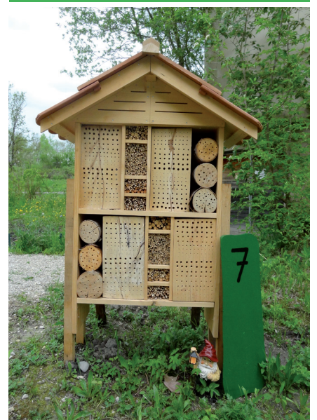
Les aménagements extérieurs permettent de découvrir notamment un nouvel hôtel à insectes.