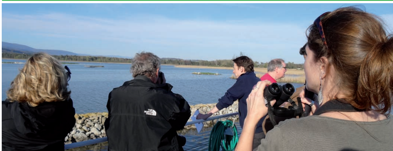
Une croisière «Nature pure» ravit les participants.

de la partie orientale de la rive a été mis sur pied. L'offre comprend également une courte visite du centre-nature, ainsi qu'un buffet servi sur le bateau. Tôt le matin ou au coucher du soleil, le paysage et les oiseaux de la rive offrent un spectacle magnifique, commenté par un guide naturaliste. 188 personnes ont pris part cette saison à cette offre qui sera reconduite l'an prochain.